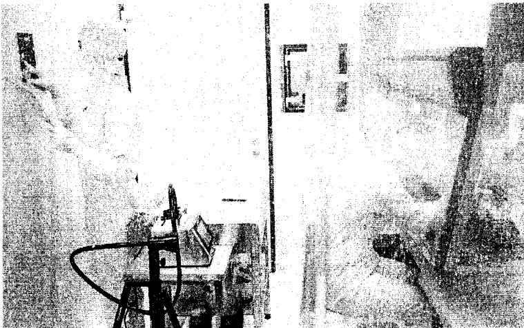
Proti rakovině Sotio patří do skupiny PPF a založil ho finančník Petr Kellner. Je to jediná česká biotechnologická firma, která hledá nadějně preparáty proti rakovině. Na snímku laboratoř Sotia.